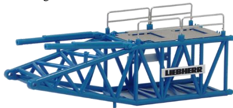
693380 Ladegut Kranteil "Liebherr" ..... 8,50 (120 mm)