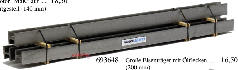
693648 Große Eisenträger mit Ölflecken ..... 16,50 (200 mm)