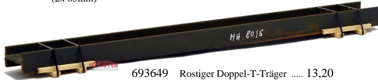
693649 Rostiger Doppel-T-Träger ..... 13,20 (200 mm)