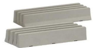
693113 deltabloc ..... 4,50 (8 Stück à 68 mm)