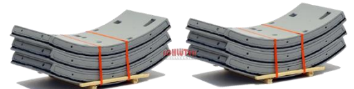
693645 Tübbinge, 2x 3er Stapel ..... 20,50 (2x 65mm)