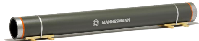
693554 Pipeline-Großröhre "Mannesmann" (200 mm) ... 14,90