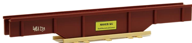
693525 Stahlbauteil (190 mm) ..... 13,50