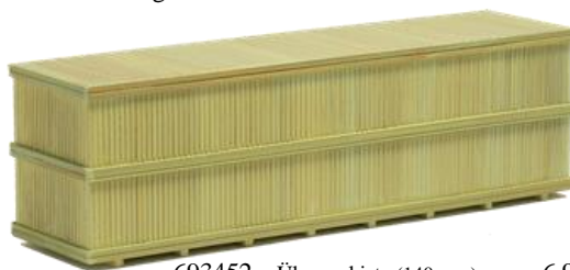
693452 Überseekiste (140 mm) ..... 6,90