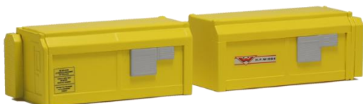
693587 Wohncontainer "Wiebe" (Set B) (2x 70 mm) ..... 18,50