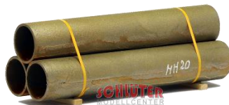
693599 Eisenröhren angerostet (85 mm) .... 8,50