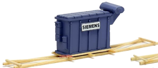
693643 Transformator "Siemens" ..... 18,50 auf Transportgestell (140 mm)