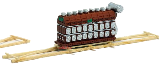
693644 Dieselmotor "MaK" auf ..... 18,50 Transportgestell (140 mm)