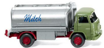
0807 48 Milchwagen (MAN 415) UVP 13,99 €

WIKING lässt die neue Generation der MB E-Klasse als Version mit geschlossenem Dach Premiere feiern. Genauso debütieren der Volvo Amazon als Viertürer und der legendäre VW 411 als Feuerwehr-Einsatzleitwagen. Eine aufwendige Neuentwicklung stellt WIKING mit dem multifunktionalen Fuchs Seilbagger F 301 vor, der dank seiner vielseitigen Beweglichkeit alle Werte seines Vorbilds in den Maßstab 1:87 trägt. Als weitere Klassiker erscheinen der MAN 415 als Milchwagen, der Langholztransporter mit Magirus S 3500