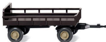
0869 03 Landwirtschaftlicher Anhänger UVP 6,99 €