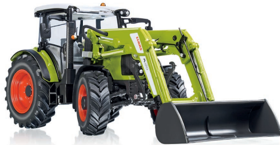
0778 29 Claas Arion 430 mit Frontlader 120 UVP 74,95 €