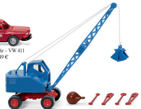
0662 01 Seilbagger (Fuchs F 301) UVP 22,99 €