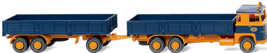
0433 04 Pritschenhängerzug (Scania 111) UVP 20,99 €