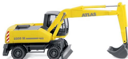
0661 03 Mobilbagger (Atlas 2205 M) UVP 17,99 €