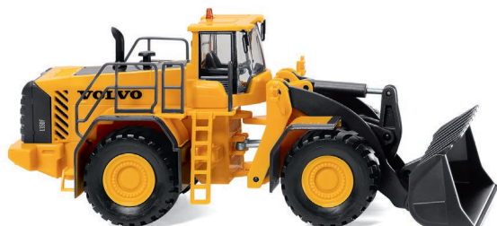
0652 02 Radlader (Volvo L 350F) UVP 29,99 €