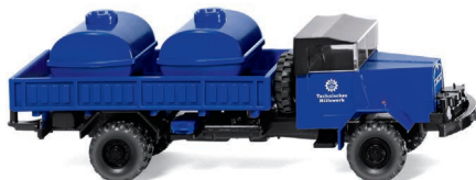
0693 28 THW – Behelfstankwagen (MAN) UVP 13,99 €