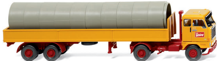
0515 01 Alupritschensattelzug (Volvo F88) UVP 21,49 €