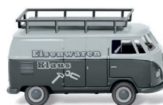
0788 03 VW T1 (Typ 2) Kastenwagen UVP 16,99 €