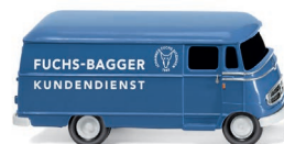
0265 03 Kastenwagen (MB L 319) UVP 10,99 €