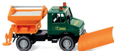
0646 08 Winterdienst – Unimog U 1300 UVP 12,99 €