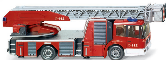
0627 04 Feuerwehr – Metz DL 32 (MB Econic) UVP 32,99 €

A ktualität auf allen 1:87-Baustellen: WIKING lässt den imposanten Volvo Radlader L 350F, aber auch den Atlas-Mobilbagger 2205 M ins Programm fahren. Beide Spezialisten erreichen durch vollfunktionale Ladebewegungen ein hohes Maß an modellbauerischer Vorbild-authentizität. Außerdem können sich Feuerwehrfreunde über die Metz-Drehleiter DL 32 freuen, die auf dem Niederflurfahrgestell des Mercedes-Benz Econic für jeden Rettungseinsatz gerüstet ist. Für den Winterdienst auf dem Speditionsgelände des Logistikers