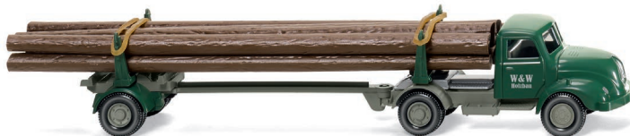
0390 10 Langholztransporter (Magirus S 3500) UVP 16,99 €