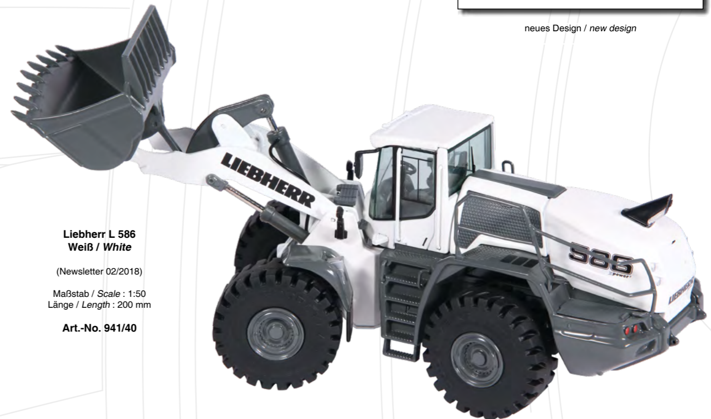
Liebherr L 586 Weiß / White