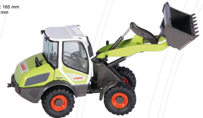
Claas Torion 639 (Newsletter 09/2018) Maßstab / Scale : 1:50 Länge / Length : 120 mm Art.-No. 980