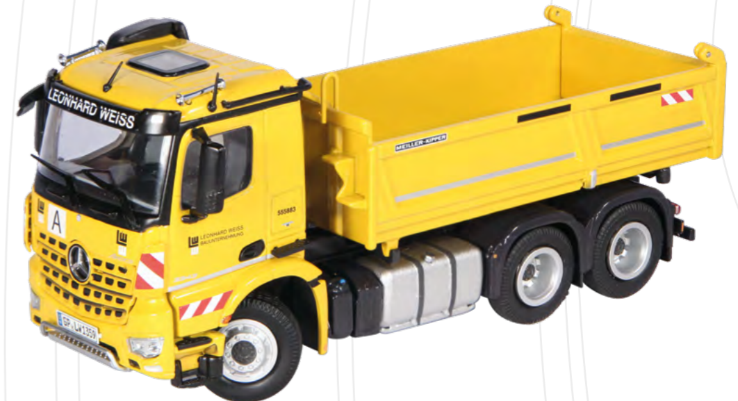
Mercedes-Benz Arocs 6x4 Meiller Kipper „Leonhard Weiss“ (Newsletter 04/2018) Maßstab / Scale : 1:50 Länge / Length : 155 mm Art.-No. 923/01