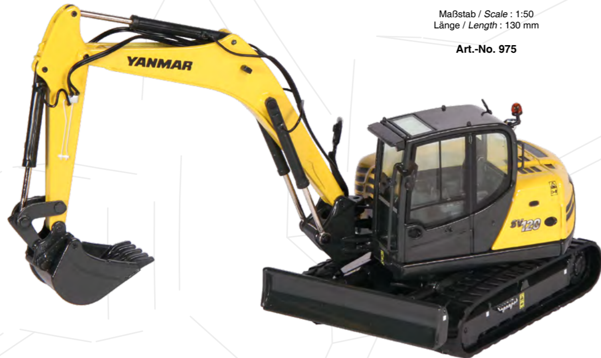
Yanmar SV120 (Newsletter 06/2018) Maßstab / Scale : 1:50 Länge / Length : 130 mm Art.-No. 975