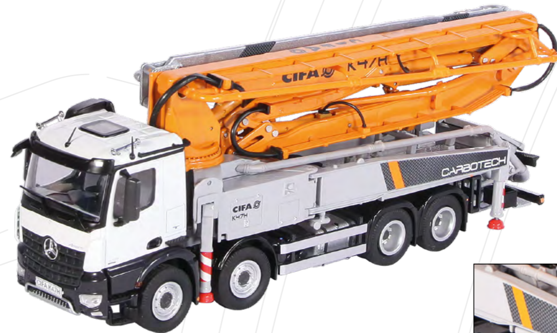
CIFA K47H Mercedes-Benz Arocs 8x4 Autobetonpumpe / Truck mounted concrete pump