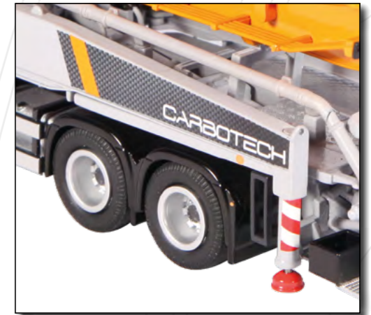
neues Design / new design