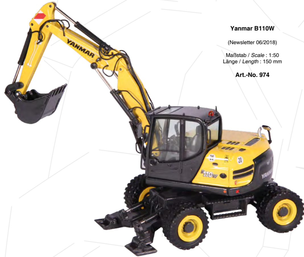
Yanmar B110W (Newsletter 06/2018) Maßstab / Scale : 1:50 Länge / Length : 150 mm Art.-No. 974