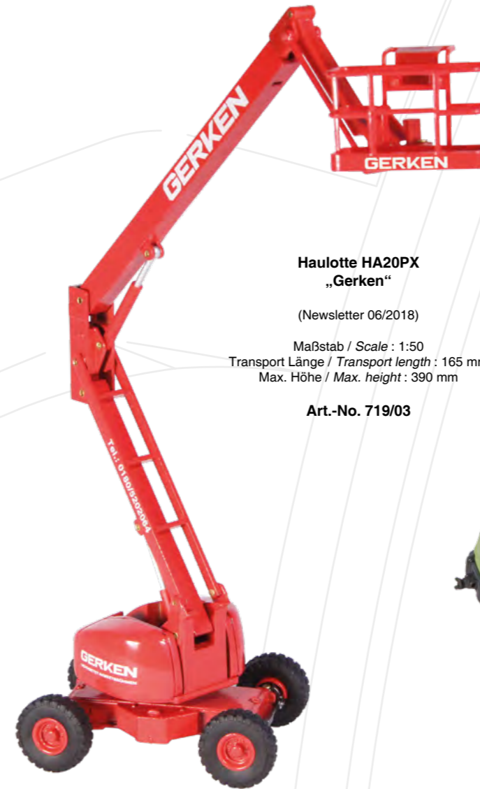
Haulotte HA20PX „Gerken“ (Newsletter 06/2018) Maßstab / Scale : 1:50 Transport Länge / Transport length : 165 mm Max. Höhe / Max. height : 390 mm Art.-No. 719/03