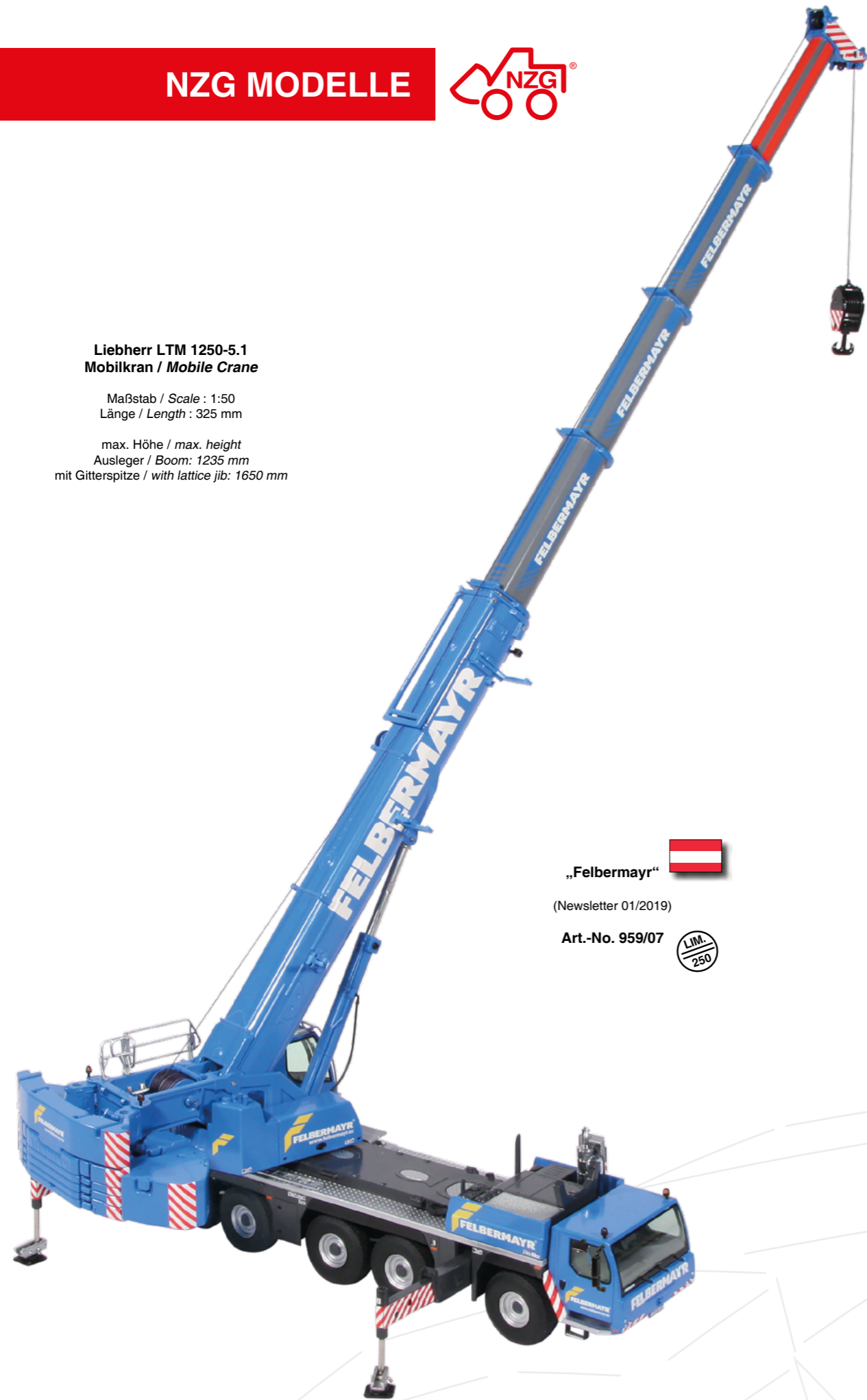
Liebherr LTM 1250-5.1 Mobilkran / Mobile Crane

Maßstab / Scale : 1:50 Länge / Length : 325 mm