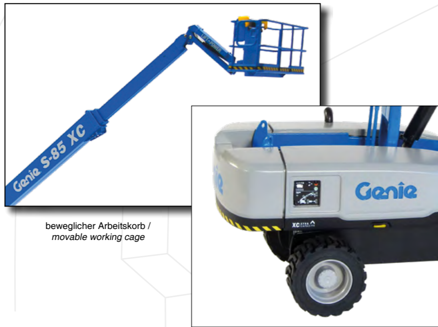
beweglicher Arbeitskorb / movable working cage