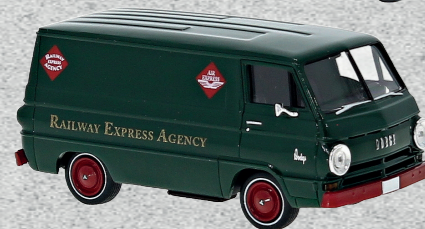
◀ Dodge A 100 Van, REA (USA), 1964 Nr. 34370 15,95