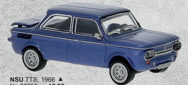
NSU TTS, 1966 ▲ Nr. 28253 15,95