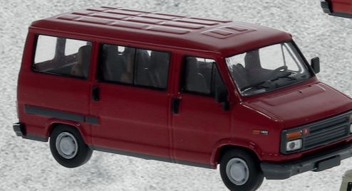
◀ Citroen C25 Bus, 1982 Nr. 34907 17,95