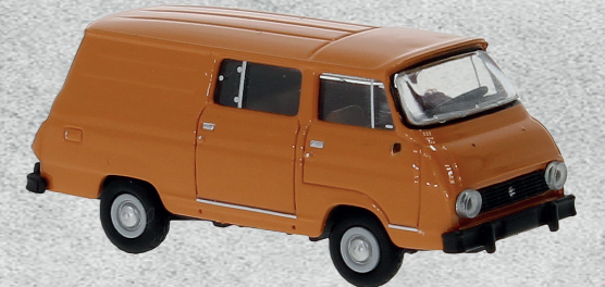
Skoda 1203 Halibus, 1969 Nr. n 30804 16.95 ▼