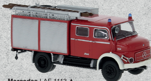
Mercedes LAF 1113 ▲ TLF 16, 1972 Nr. v 47170 35.95