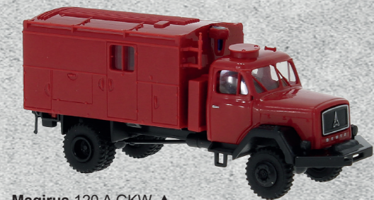
Magirus 120 A GKW ▲ Nr. v 46435 19.95