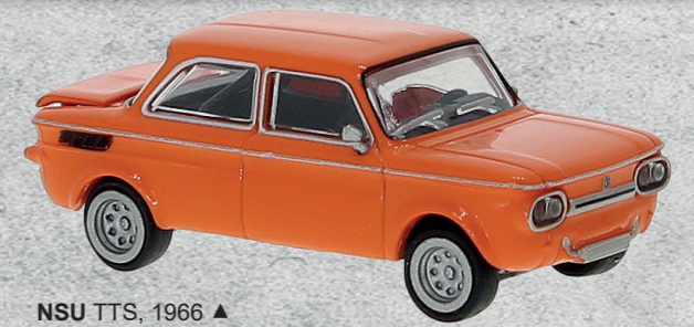
NSU TTS, 1966 ▲ Nr. 28251 15,95