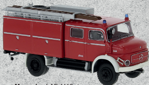
Mercedes LAF 1113 ▲ TLF 16, 1972 Nr. v 47171 35.95