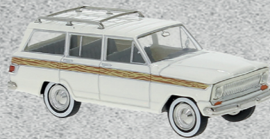
◀ Jeep Wagoneer B, Wooden Stripe, 1968 Nr. v 19870 18,95