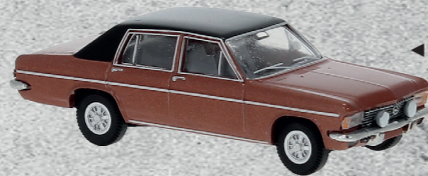
◀ Opel Diplomat Nr. v 20719 14,95