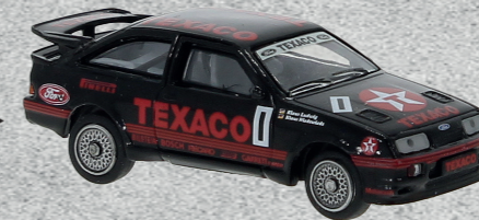
Ford Sierra RS 500 Cosworth, 1988 ▶ Nr. 19253 19,95