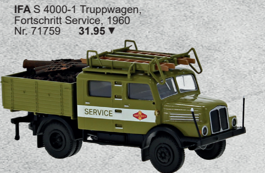
IFA S 4000-1 Truppwagen, Fortschritt Service, 1960 Nr. 71759 31.95 ▼