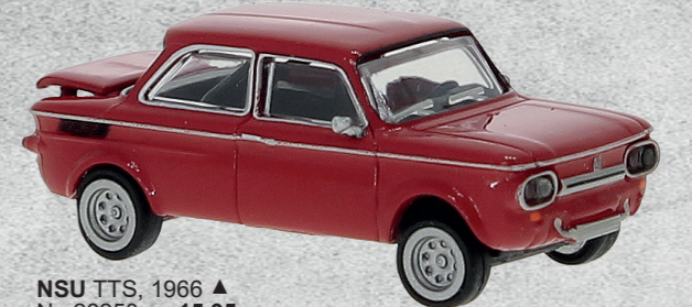
NSU TTS, 1966 ▲ Nr. 28250 15,95