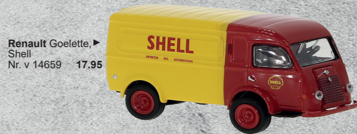
Renault Golette, Shell Nr. v 14659 17.95