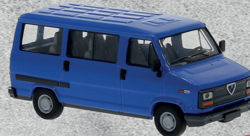
◀ Alfa Romeo AR 6 Bus, 1985 Nr. 34903 17,95