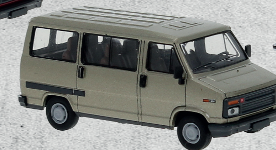
Citroen C25 Bus, 1982 ▶ Nr. 34906 18,95