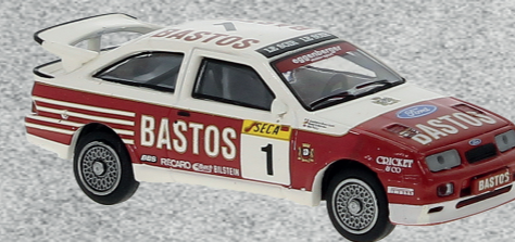
◀ Ford Sierra RS 500 Cosworth, 1989 Nr. 19254 19,95