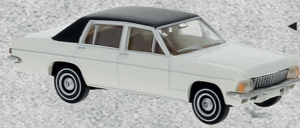
◀ Opel Admiral, 1969 Nr. v 20724 14,95