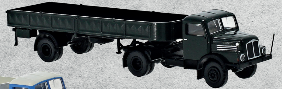
IFA S 4000-1, Pritschen-SZ, 1960 ▶ Nr. 71401 24.95