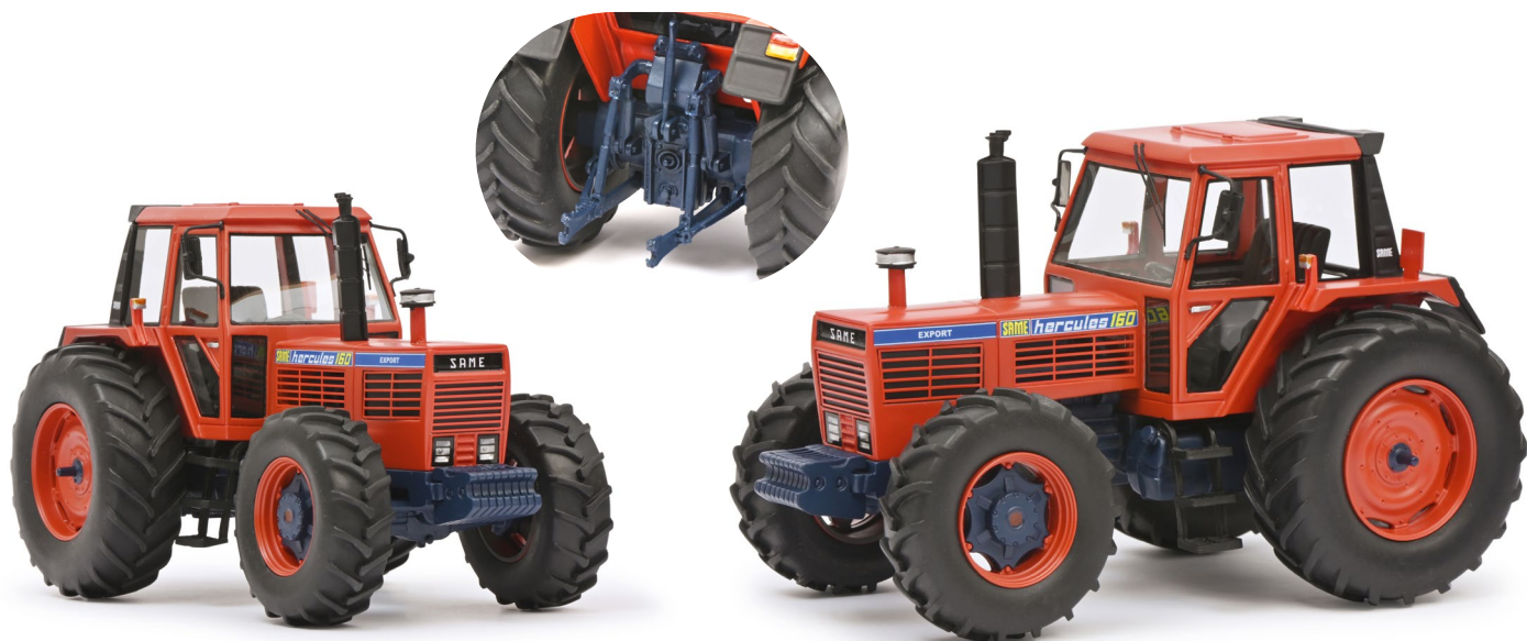
LIMITED EDITION 250