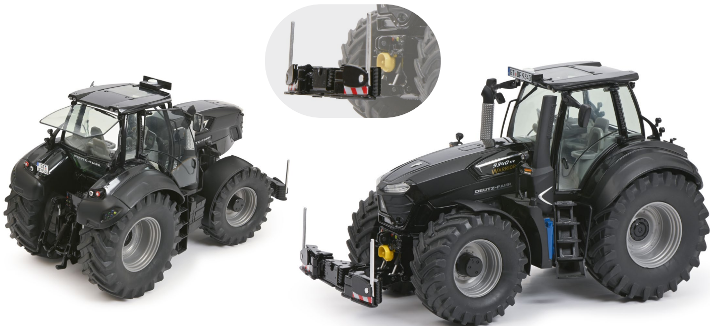
LIMITED EDITION 1000

LIMITED EDITION. UNLIMITED PERFORMANCE. These are the keywords with which Deutz-Fahr presents the Deutz 9340 TTV WARRIOR as the most powerful WARRIOR special model ever. With its 346 hp, the 9340 TTV WARRIOR is an ultra-modern and highly intelligent large tractor with unique operating comfort, automated routine functions and the most advanced technologies. Its highly efficient Deutz engine with state-of-the-art exhaust technology, continuously variable TTV transmission for precise speeds from 0.2 to 60 km/h, newly developed axle suspension, 12,000 kg lift capacity, electrically opening engine hood and stunning design - every single component of the 9340 TTV WARRIOR is highly innovative and among the best currently available on the market for large tractors. Like its large role model, the Schuco metal model also has a large number of interesting details and, with its model weight of 650 grams, represents a real heavyweight.