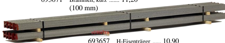
693657 H-Eisenträger ..... 10,90 (200 mm)