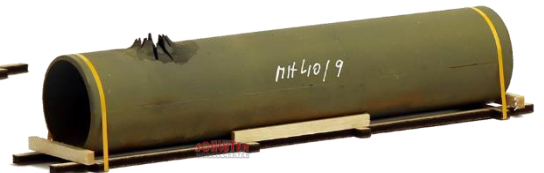
693653 Rohr, angerostet, geborsten ..... 12,20 (140 mm)