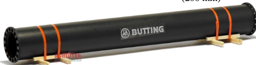
693662 kleines Flanschrohr "Butting" ..... 18,50 (140 mm)