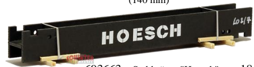
693663 Stahlträger "Hoesch" ..... 18,50 (130 mm)