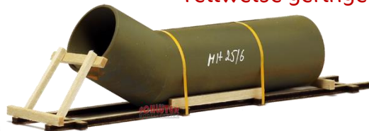
693654 Knickrohr, angerostet ..... 12,40 (140 mm)