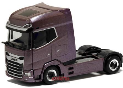
610512 DAF XG Zugm. 2achs svsp. ... 24,90 (pearlbrombeer-metallic)