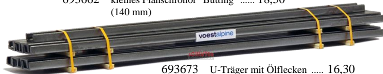
693673 U-Träger mit Ölflecken ..... 16,30 (200 mm)