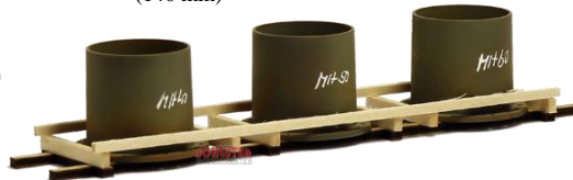
693655 Flansche, angerostet ..... 11,90 (140 mm)