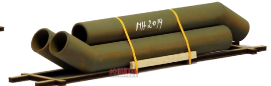
693656 Knickrohre, angerostet ..... 12,00 (140 mm)