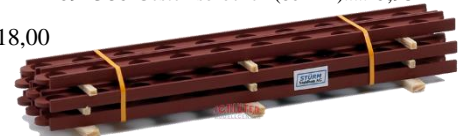
693710 Lochträger (105 mm) ..... 15,00