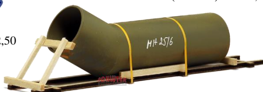
693654 Knickrohr, angerostet ..... 12,40 (140 mm)