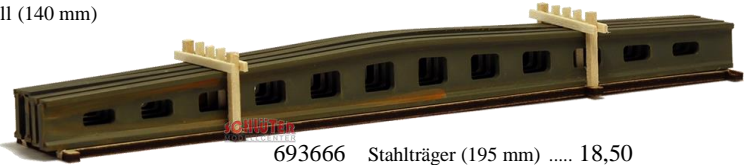
693666 Stahlträger (195 mm) ..... 18,50