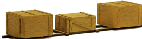
693544 Kistensortiment auf Transportgestell (140 mm) .... 16,90