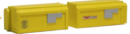
693587 Wohncontainer "Wiebe" (Set B) (2x 70 mm) ..... 18,50