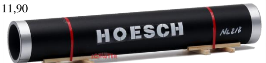
693706 Pipeline-Großröhre "Hoesch", schwarz (130 mm) ..... 11,90 - Sonderauflage Intermodellbau 2024 --