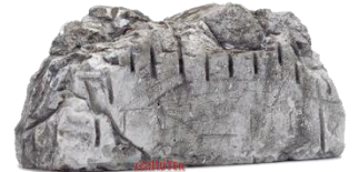
692380 Gesteinsbrocken (80 mm)..... 0,95