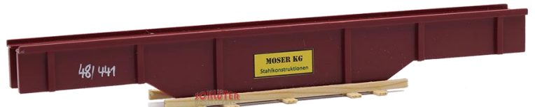
693708 Trägerteil (190 mm) ..... 15,00