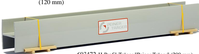
693472 H-Profil-Träger "Peiner Träger" (200 mm) .... 17,50