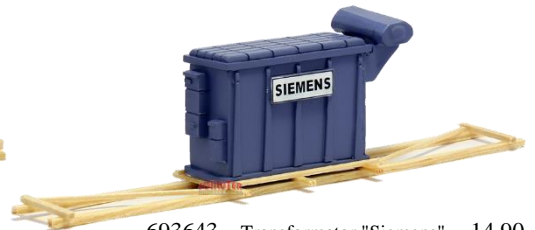
693643 Transformator "Siemens" ... 14,90 auf Transportgestell (140 mm)