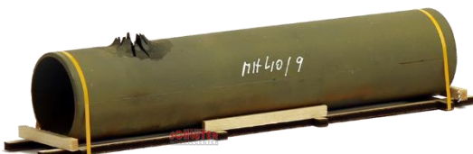
693653 Rohr, angerostet, geborsten ..... 12,20 (140 mm)