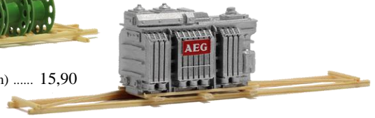
693535 Transformator "AEG" (140 mm) . 18,90