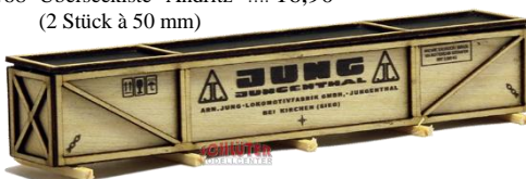
693627 Überseekiste "Jung Jungenthal" ..... 18,90 (120 mm)