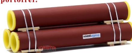
693712 Großröhren mit Schutzkappen (120 mm) .... 18,00