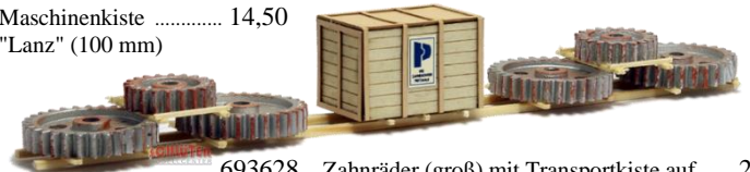
693628 Zahnräder (groß) mit Transportkiste auf ..... 23,50 Transportgestell (200 mm)