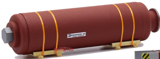
693711 Tankbehälter (130 mm) ..... 18,00