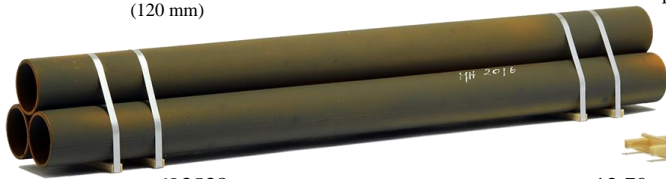
693538 Stahlröhren, leicht angerostet (205 mm) ..... 12,70