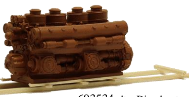
693534 alter Dieselmotor (140 mm) . 22,90