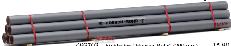
693703 Stahlrohre "Hoesch-Rohr" (200 mm) ..... 15,90 -- Sonderauflage Intermodellbau 2024 --