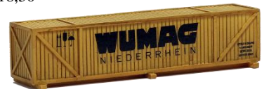
693478 Maschinenkiste ..... 14,30 "Wumag" (100 mm)