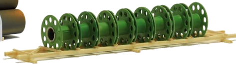
693537 Kabelspulen (140 mm) ..... 15,90