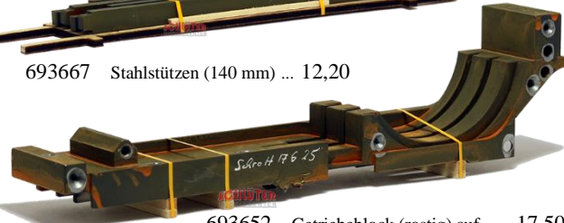
693652 Getriebeblock (rostig) auf ..... 17,50 Transportgestell (175 mm)