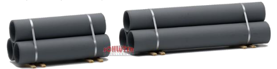
693709 Betonröhren (50 mm + 80 mm) .... 15,00