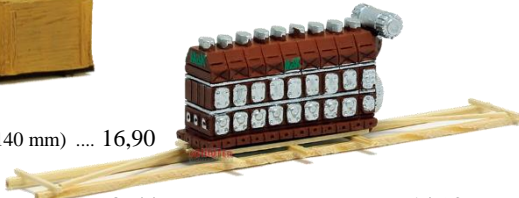
693644 Dieselmotor "MaK" ..... 14,90 auf Transportgestell (140 mm)