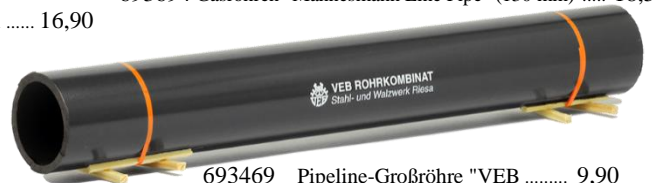
693469 Pipeline-Großröhre "VEB ..... 9,90 Rohrkombinat Riesa" (196 mm)