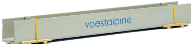
693474 U-Profil-Träger "Voestalpine" ..... 13,90 (200 mm)