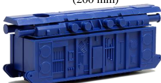
693422 Transformator für ..... 12,50 Schwerlastmodelle, enzianblau