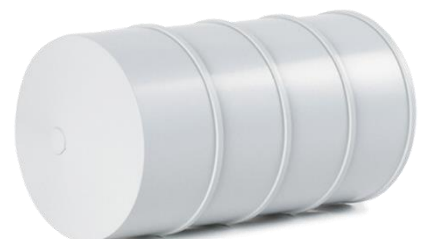
692364 Ariane - Bauteile ..... 4,90