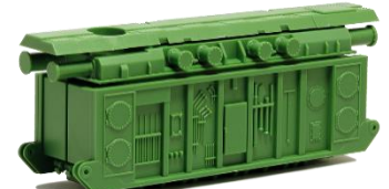
693423 Transformator für ..... 14,50 Schwerlastmodelle, resedagrün