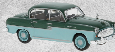
Sachsenring P240 grün/türkis, 1956 Nr. 27481 10.00 € 🔥