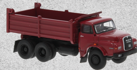
MAN 26.280 DHAK, rubinrot, 1972 ▲ Nr. 78103 17.50 € 🔥