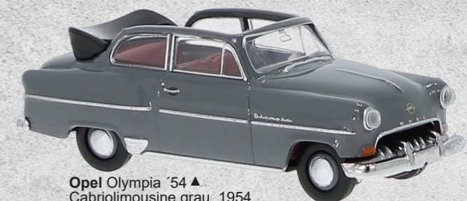
Opel Olympia '54 ▲ Cabriolimousine grau, 1954 Nr. 20250 16.95 €