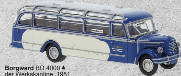
Borgward BO 4000 ▲ der Werkskantine, 1951 Nr. 52405 17.50 € 🔥