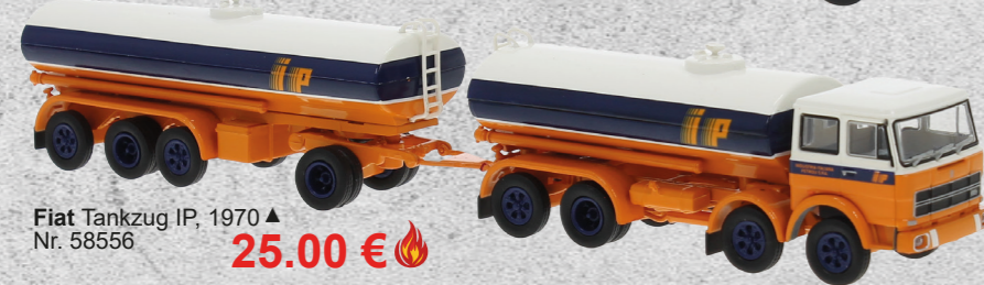
Fiat Tankzug IP, 1970 ▲ Nr. 58556 25.00 € 🔥