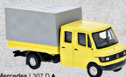
Mercedes L307 D ▲ Doka, gelb, 1988 Nr. 36950 15.00 € 🔥