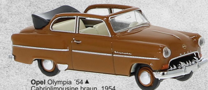
Opel Olympia '54 ▲ Cabriolimousine braun, 1954 Nr. v 20252 16.95 €