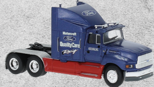
Ford Aeromax "Ford Racing", 1990 ▲ Nr. v 85906 27.95 €