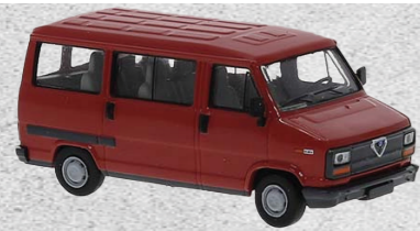
Alfa Romeo AR6, rot, 1985 Nr. 34902 12.50 € 🔥