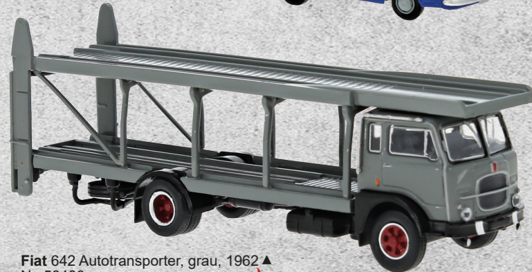
Fiat 642 Autotransporter, grau, 1962 ▲ Nr. 58486 17.50 € 🔥