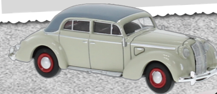
Opel Admiral Cabrio, 1938 Nr. 20454 19.95 €