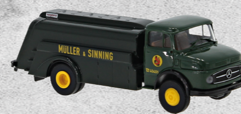
Mercedes L322 Tankwagen ▲ "Müller&Sinnig", 1960 Nr. 47040 12.50 € 🔥