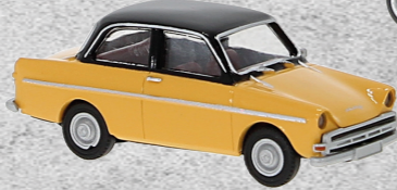
DAF 750 gelb/schwarz, 1960 Nr. 27719 7.50 € 🔥