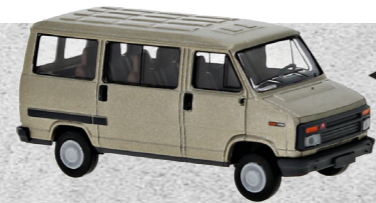
Citroen C25, gold, 1982 Nr. 34906 12.50 € 🔥