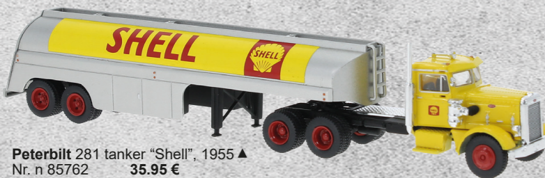
Peterbilt 281 tanker "Shell", 1955 ▲ Nr. n 85762 35.95 €