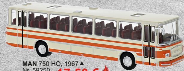
MAN 750 HO, 1967 ▲ Nr. 59250 17.50 € 🔥