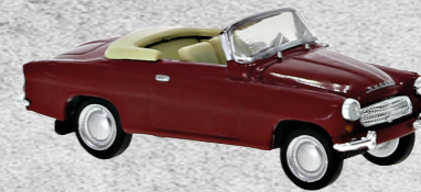
Skoda Felicia rubinrot, 1959 Nr. 27437 10.00 € 🔥