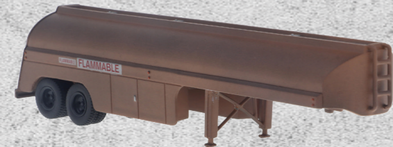
Solo-Tankaufleger "Rusty", 1955 ▲ Nr. n 55961 16.95 €

Die Abbildungen sind unverbindlich, Änderungen bleiben vorbehalten. Die genannten €-Preise verstehen sich, soweit angegeben, als unverbindliche Preisempfehlungen nur für den Fachhandel in Deutschland. Irrtümer und Preisänderungen bleiben vorbehalten.