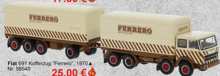
Fiat 691 Kofferzug "Ferrero", 1970 ▲ Nr. 58540 25.00 € 🔥