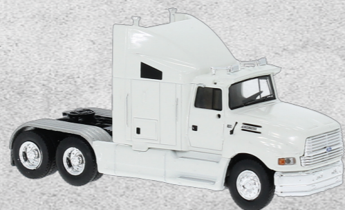
Ford Aeromax weiß, 1990 ▲ Nr. v 85908 27.95 €

Die Abbildungen sind unverbindlich, Änderungen bleiben vorbehalten. Die genannten €-Preise verstehen sich, soweit angegeben, als unverbindliche Preisempfehlungen nur für den Fachhandel in Deutschland. Irrtümer und Preisänderungen bleiben vorbehalten.