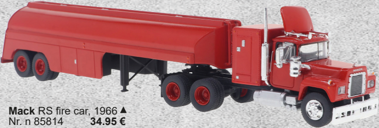
Mack RS fire car, 1966 ▲ Nr. n 85814 34.95 €