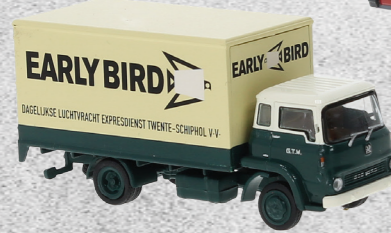
Bedford TK Koffer "Geldersche TW", 1960 Nr. 35911 12.50 € 🔥