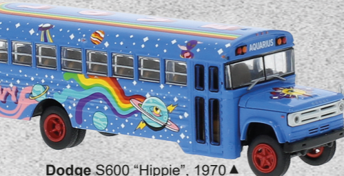
Dodge S600 "Hippie", 1970 ▲ Nr. v 61334 32.95 €