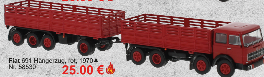
Fiat 691 Hängerzug, rot, 1970 ▲ Nr. 58530 25.00 € 🔥