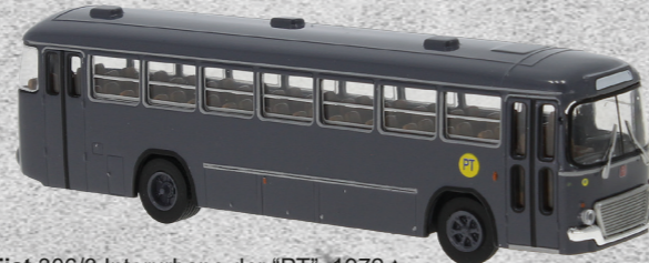
Fiat 306/3 Interurbano der "PT", 1972 ▲ Nr. 59902 15.00 € 🔥