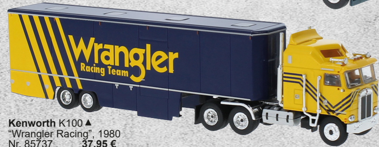
Kenworth K100 ▲ "Wrangler Racing", 1980 Nr. 85737 37.95 €