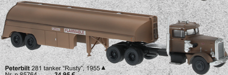
Peterbilt 281 tanker "Rusty", 1955 ▲ Nr. n 85764 34.95 €