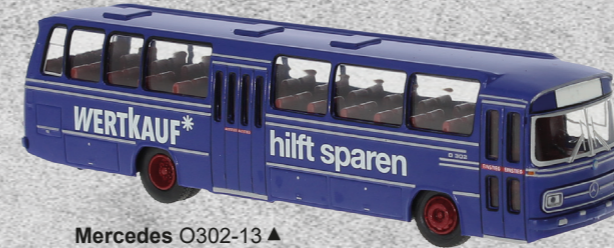
Mercedes O302-13 ▲ "Wertkauf", 1970 Nr. 52103 17.50 € 🔥