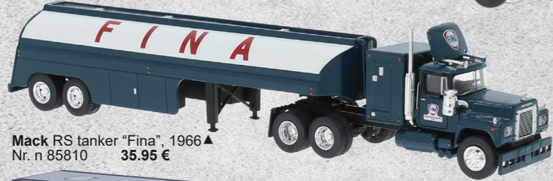
Mack RS tanker "Fina", 1966 ▲ Nr. n 85810 35.95 €