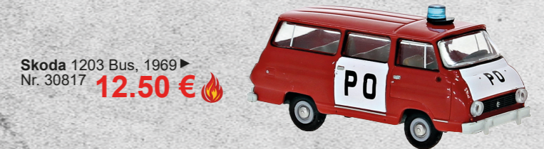
Skoda 1203 Bus, 1969 ▶ Nr. 30817 12.50 € 🔥