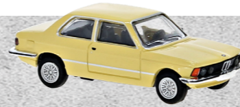
BMW 323i, beige, 1975 Nr. 24303 10.00 € 🔥