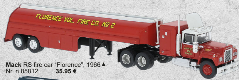
Mack RS fire car "Florence", 1966 ▲ Nr. n 85812 35.95 €