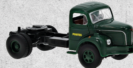
Berliet Zugmaschine "Postes", 1950 Nr. 85434 7.50 € 🔥