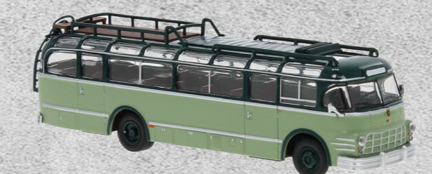
Saurer 5 GVF-U, 1951 ▲ Nr. 58066 12.50 € 🔥