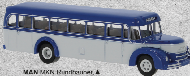
MAN MKN Rundhauber, ▲ blau/weiß, 1952 Nr. 59220 17.50 € 🔥