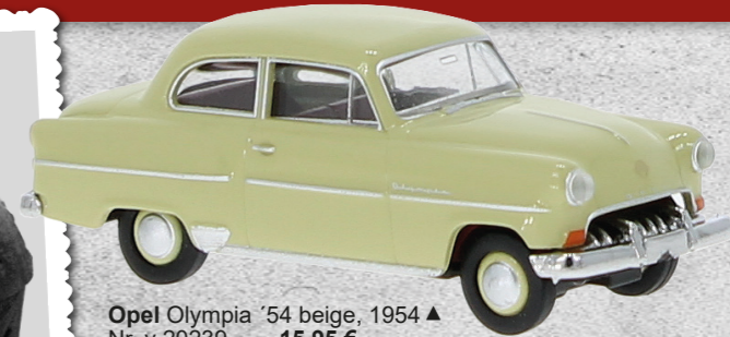
Opel Olympia '54 beige, 1954 ▲ Nr. v 20239 15.95 €