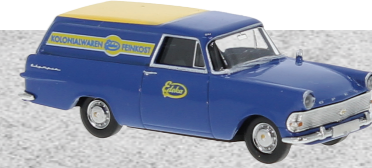
Opel P2 Kasten "EDEKA", 1960 Nr. 20156 7.50 € 🔥