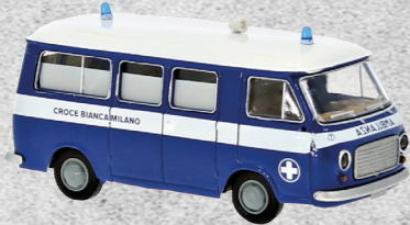
Fiat 238 "Croce bianca Milano", 1966 ▶ Nr. 34418 10.00 € 🔥