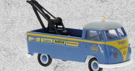
VW T1b Abschleppwagen "Varta", 1960 ▲ Nr. v 32982 19.95 €