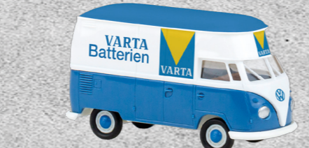
VW T1b Großraumkasten "Varta", 1960 ▲ Nr. v 32622 17.95 €