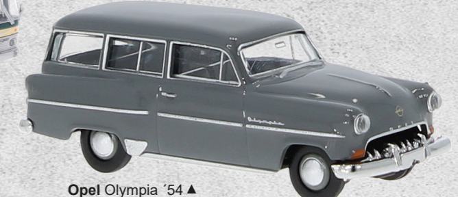
Opel Olympia '54 ▲ Caravan grau, 1954 Nr. v 20243 15.95 €