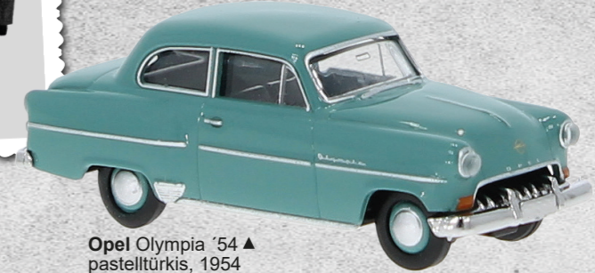
Opel Olympia '54 ▲ pastelltürkis, 1954 Nr. v 20240 15.95 €