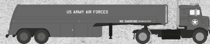
Kenworth Bullnose tanker "US Army", 1955 ▲ Nr. n 85957 35.95 €