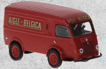
Renault 1000kg "Aigle Belgica", 1950 ▶ Nr. 14668 10.00 € 🔥