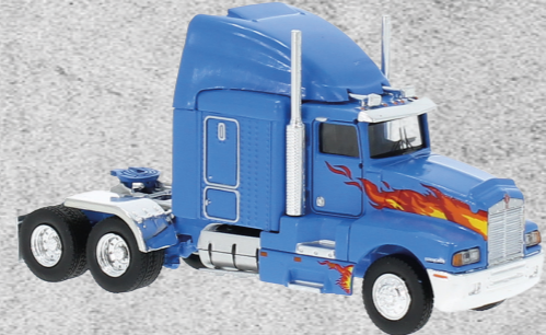
Kenworth T 600 "flames", 1984 ▲ Nr. v 85934 27.95 €