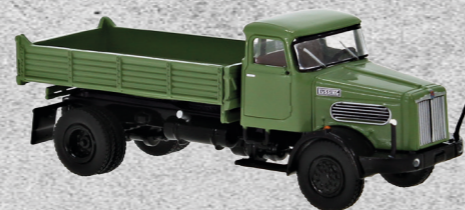
Büssing Commodore Kipper, 1963 ▲ Nr. 79251 17.50 € 🔥