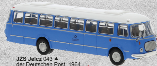
JZS Jelcz 043 ▲ der Deutschen Post, 1964 Nr. 58270 17.50 € 🔥