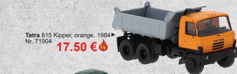
Tatra 815 Kipper, orange, 1984 ▶ Nr. 71904 17.50 € 🔥