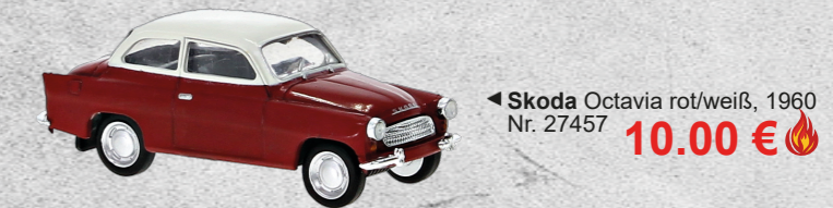
Skoda Octavia rot/weiß, 1960 Nr. 27457 10.00 € 🔥