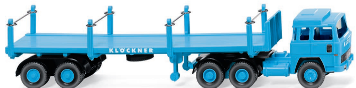
0518 46 Rungensattelzug (Magirus 235 D) UVP 19,99 €