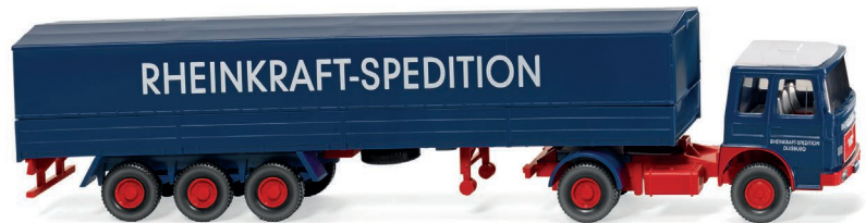
0517 01 Pritschensattelzug (MAN) UVP 21,49 €