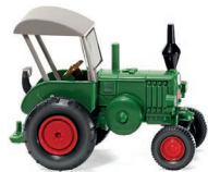
0880 08 Lanz Bulldog mit Dach UVP 9,99 €