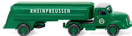
0800 49 Tanksattelzug (Magirus S 3500) UVP 17,99 €