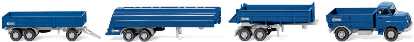
Bestandteile Set "Blumhardt"