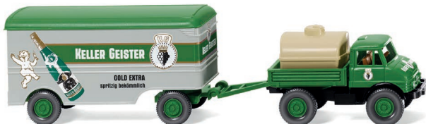
0371 06 Unimog U 406 mit Kofferranhänger UVP 19,99 €