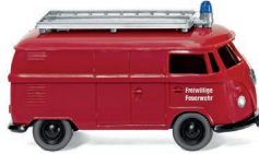
0861 41 Feuerwehr – VW T1 Kastenwagen UVP 10,99 €