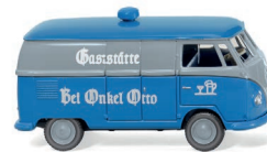
0788 04 VW T1 (Typ 2) Kastenwagen UVP 16,99 €