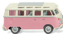
0797 20 VW T1 Sambabus UVP 16,99 €