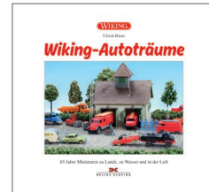
0006 45 Buch "Wiking-Autoträume" 34,90 €