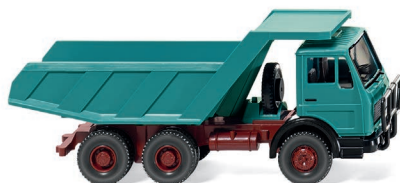
0671 05 Muldenkipper (MB NG) UVP 13,99 €