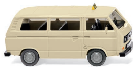
0800 14 Taxi – VW T3 Bus UVP 10,99 €