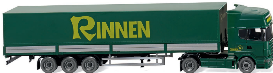
0518 04 Pritschensattelzug (Scania R 420 Topline) UVP 28,99 €