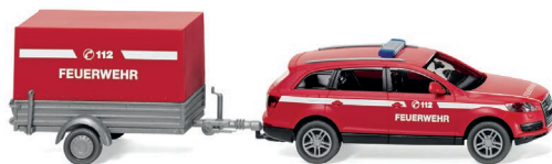
0133 07 Feuerwehr – Audi Q7 mit Anhänger UVP 19,99 €