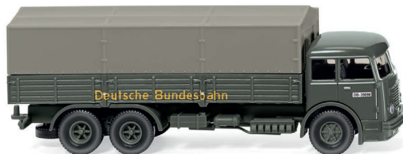
0479 02 Pritschen-Lkw (Büssing 12.000) UVP 23,99 €