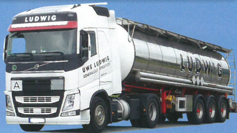
75274 Volvo "12" XL/Aerop. – (H) Tank-SZ »Ludwig« € 29,95*