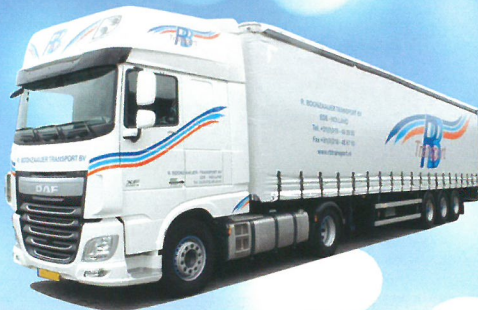
75305 DAF XF 106 SSC/Aerop. – G-KSZ »Boonzaaijer« € 29,95*