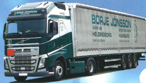
75280 Volvo "12" XL/Aerop. – PrSZ »Börje Jönsson« € 29,95*