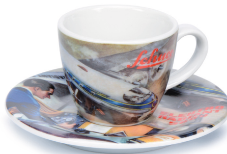
Schuco Espressotasse/espresso cup „Radiant“