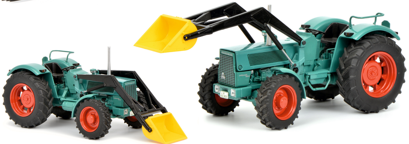
Hanomag Robust 900 mit Frontlader/with front loader 45 077 9900

Der Hanomag-Radschlepper Robust 900 war der größte und stärkste in Serie produzierte Hanomag-Schlepper aller Zeiten und wurde von 1967 bis 1970 produziert. Im Wesentlichen unterschied er sich vom Brilliant 701 durch seinen größeren und stärkeren Motor, der es auf eine Leistung von 85 PS brachte. Schuco präsentiert diesen typischen Schlepper der 60er-Jahre als hochwertige Metall-Miniatur mit funktionierendem Frontlader im Sammler-Maßstab 1:32. Die Schuco Edition 1:32 überzeugt durch ihre sehr detaillierte und präzise Umsetzung. Der Traktor verfügt über eine funktionierende Lenkung und darf in keiner Traktorensammlung fehlen.