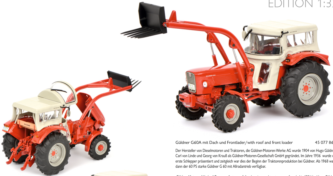
Güldner G60A mit Dach und Frontlader/with roof and front loader 45 077 8600

Der Hersteller von Dieselmotoren und Traktoren, die Güldner-Motoren-Werke AG wurde 1904 von Hugo Güldner, Carl von Linde und Georg von Krauß als Güldner-Motoren-Gesellschaft GmbH gegründet. Im Jahre 1936 wurde der erste Schlepper präsentiert und zeitgleich war dies der Beginn der Traktorenproduktion bei Güldner. Ab 1968 war dann der 60 PS starke Güldner G 60 mit Allradantrieb verfügbar.