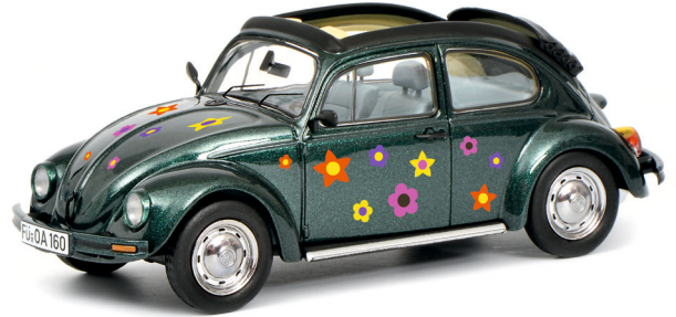
VW Käfer Open Air „Blumen-Dekor“, grün/green*