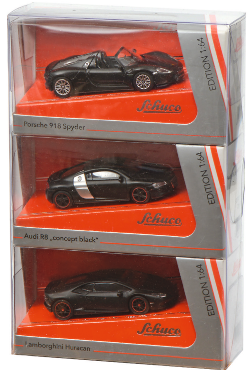
3er Set „concept black“ Porsche 918 Spyder, Audi R8 Coupé, Lamborghini Huracán