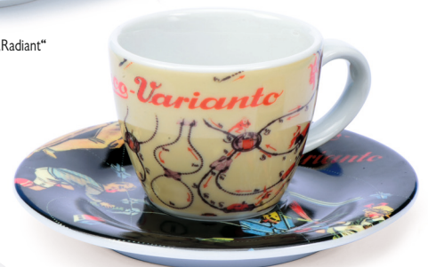
Schuco Espressotasse/espresso cup „Varianto“