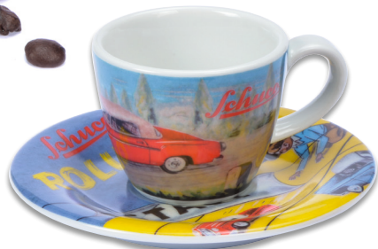
Schuco Espresso Tasse/espresso cup „Schuco Rollfix“