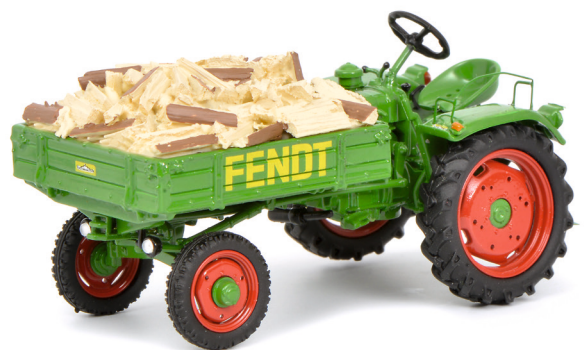
Fendt Geräteträger GT mit Ladegut „Scheitholz“/with fire wood load