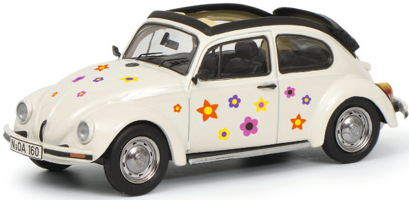
VW Käfer Open Air „Blumen-Dekor“, weiß/white*