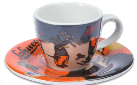
Schuco Espresso Tasse/espresso cup „Schuco Tanzfiguren“