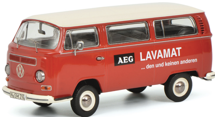
VW T2a Bus L Luxus „AEG Lavamat“, rot/red