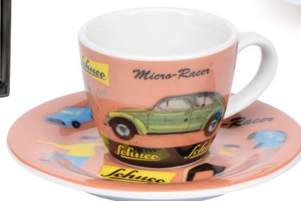
Schuco Espressotasse/espresso cup „Micro Racer“