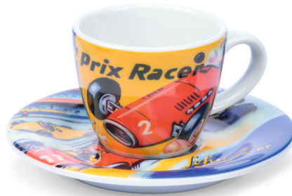
Schuco Espressotasse/espresso cup „Grand Prix Racer“