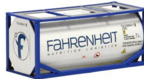
492041 Fahrenheit, 20ft. -AWM..... 5,90