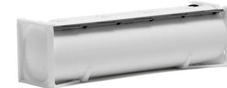
490312 30ft. Drucksilocontainer -Herpa..... 4,00