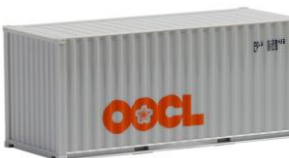
491402 OOCL, 20ft. -AWM..... 4,10