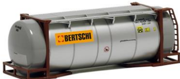
492114 Bertschi, 26ft. -AWM..... 9,20