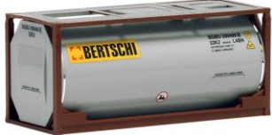
492030 Bertschi, 20ft. -Herpa..... 10,60