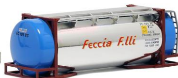
492111 Feccia F.lli, 26ft. -AWM..... 7,20