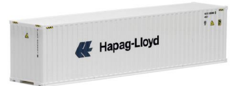
491713 Hapag-Lloyd, 40ft. HC -AWM..... 6,60