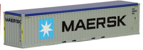
491932 Maersk, 40ft. OT -AWM..... 6,70