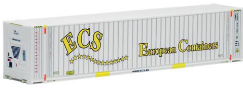
491819 ECS European Containers, 45ft. HC -AWM... 7,20