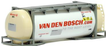
492110 v.d. Bosch, 26ft. -AWM..... 7,20