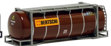
492113 Bertschi, 26ft. -AWM..... 8,70