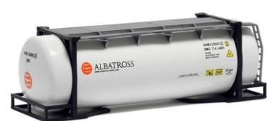
492115 Albatross, 26ft. -AWM..... 7,80