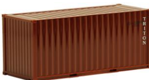
491417 Triton, 20ft. -AWM..... 3,10