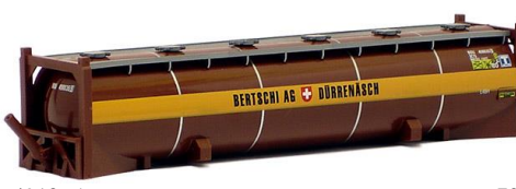
491265 Bertschi, 40ft. (altes Logo) -AWM..... 6,70