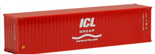
491716 ICL Group, 40ft. HC -AWM..... 8,90