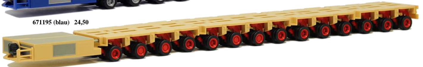
671196 (Baumann-farbig) 26,50