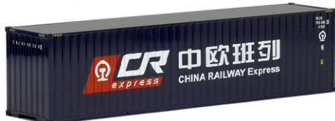
491714 China Railway Express, 40ft. HC -AWM..... 5,80