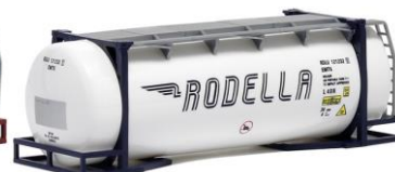
492112 Rodella, 26ft. -AWM..... 6,90