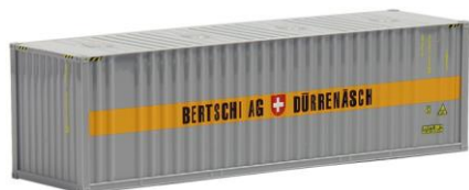
491297 Bertschi, 30ft. Bulk (altes Logo) -AWM..... 7,60