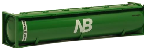
491277 Nordic Bulkers, 40ft. -Herpa..... 7,70