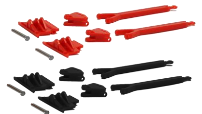
Zug- und Schubeinrichtung (2 Stück) 692517 (weiß) 2,60 / 692518 (rot) 2,60 692525 (schwarz) 2,60