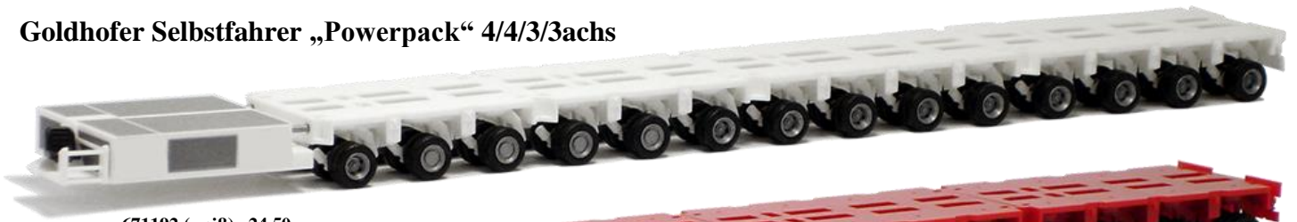
671192 (weiß) 24,50