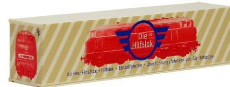
491712 LokRapid, 40ft. HC -AWM..... 8,50