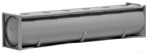
490578 40ft. Drucksilcontainer -Herpa..... 5,00