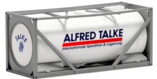
492029 Talke, 20ft. -Herpa..... 5,60