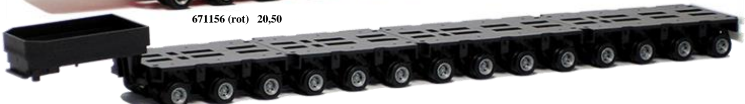
671157 (schwarz) 20,50