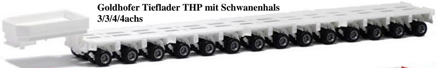
671155 (weiß) 20,50