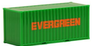
491418 Evergreen, 20ft. -AWM..... 3,20