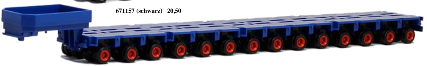
671158 (blau) 20,50