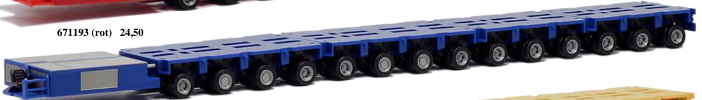
671195 (blau) 24,50