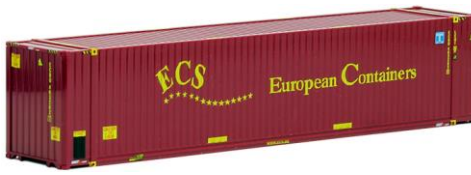
491820 ECS European Containers, 45ft. HC -AWM... 6,90