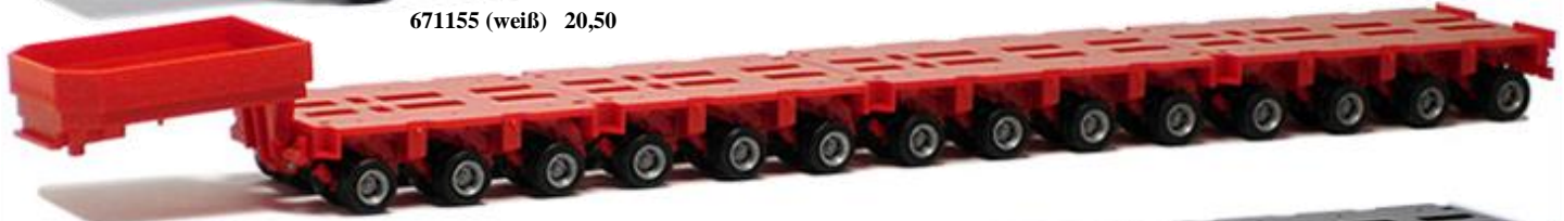
671156 (rot) 20,50