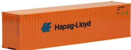
491711 Hapag-Lloyd, 40ft. HC -AWM..... 6,80