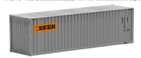
491304 Bertschi, 30ft. Bulk (neues Logo) -AWM..... 7,60