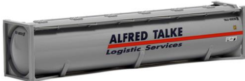
491255 Talke, 40ft. -Herpa..... 9,60