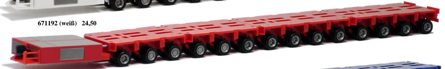
671193 (rot) 24,50