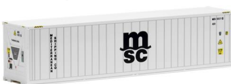
491715 MSC, 40ft. HC -AWM..... 8,60