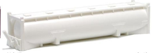
490576 40ft. Drucksilcontainer -AWM..... 3,50