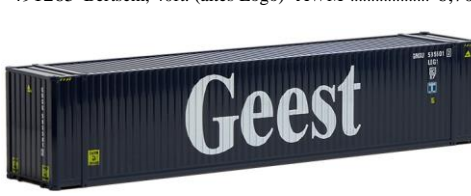
491826 Geest, 45ft. HC -AWM..... 8,70