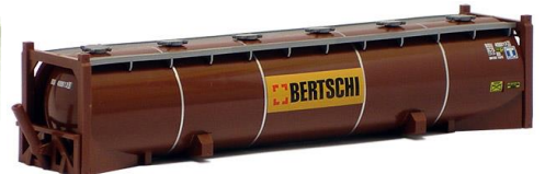
491264 Bertschi, 40ft. (neues Logo) -AWM..... 6,60