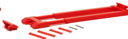
Teleskop-Kesselbrücke für Goldhofer Tieflader 692406 (weiß) 8,50 / 692420 (rot) 8,50