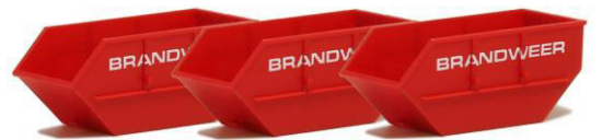
693424 Absetzmulden "Brandweer" (3 Stück) ..... 4,90