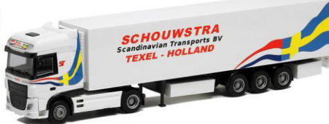
75345 Schouwstra ..... 29,00