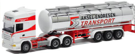
53647 Endresen transport ..... 27,00