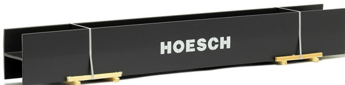
693425 H-Profil-Stahlträger auf Transportgestell "Hoesch" (195 mm) ..... 11,00