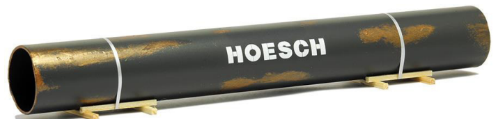
693426 Pipeline-Großröhre auf Transportgestell "Hoesch" (195 mm) ..... 11,00