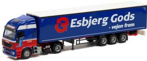
53646 Esbjerg Gods ..... 27,00