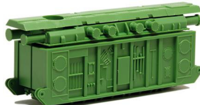
693423 Transformator, resedagrün ..... 18,50