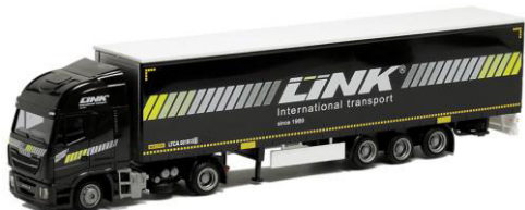
919201 Link Transport ..... 29,00