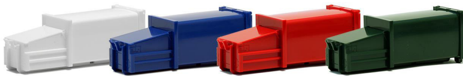
Pressmüllcontainer ..... 4,50 693427 weiß 693428 blau 693429 rot 693430 grün