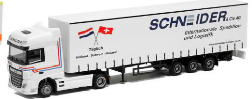
75304 Schneider Spedition ..... 29,00