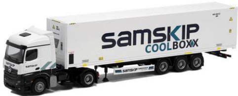
75126 Samskip "Coolboxx" ..... 29,00