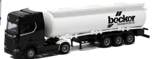
927321 Becker Transporte ..... 29,00