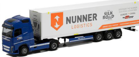
75292 TMA Logistics / Nunner ..... 29,00