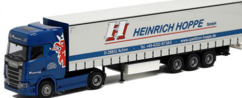
927201 Hoppe Spedition ..... 29,00