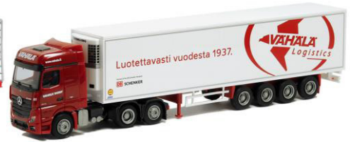
53660 Vähälä Logistics ..... 29,00