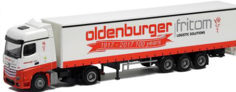
53786 Oldenburger fritom ..... 29,00