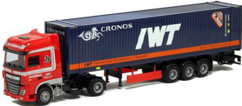
53777 Bakker / Cronos / IWT ..... 29,00