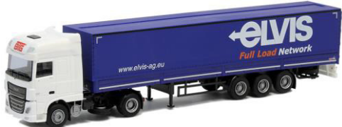
75319 BTG / Elvis ..... 29,00