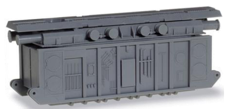
H054010 Transformator, grau ..... 18,50