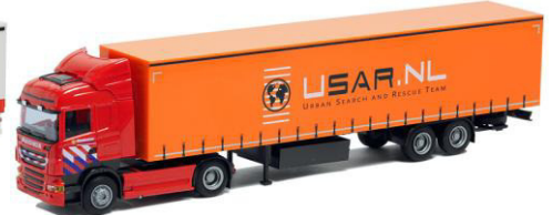
74492 Brandweer / USAR ..... 29,00