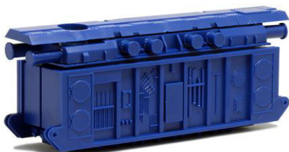
693422 Transformator, enzianblau ..... 18,50