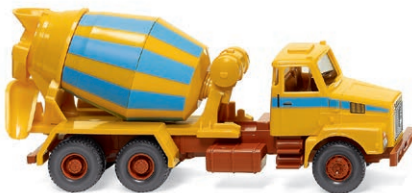
0682 07 Betonmischer (Volvo N10) Schwedischer Baustellen-Hauber UVP 21,49 € · 1973-85