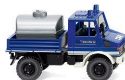
0374 03 Unimog U 1300 Einsatzspezialist mit Tankaufsatz UVP 18,99 € · 1975-88