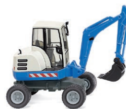
0658 07 Mini-Bagger Funktionelle Faszination in 1:87 UVP 16,99 €