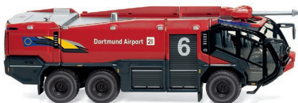
0626 48 Feuerwehr – Rosenbauer FLF Panther 6x6 Neue Generation im Airport-Einsatz UVP 38,99 €