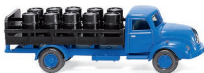
0570 03 Pritschen-Lkw (Magirus S 3500) Rundhaube – Einst das Nonplusultra UVP 17,99 € · 1958-67