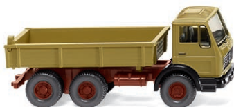
0424 06 Flachpritschenkipper (MB NG) Kipper im Mercedes Farbaufritt UVP 15,49 € · 1973-80