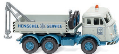
0634 08 Abschleppwagen (Henschel) Verstärkung für den Henschel Service UVP 20,99 € · 1955-61