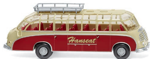
0730 03 Reisebus (Setra S8) Panoramablick – Hit der 50er Jahre UVP 21,49 € · 1952-58