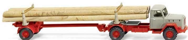
0390 11 Langholztransporter (Magirus) Saturn im Dienst der Forstwirtschaft UVP 19,99 € · 1958-64