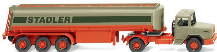
0780 06 Tanksattelzug (Magirus Deutz) Stadler unterwegs in eigener Sache UVP 25,49 € · 1970-78