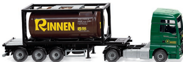
0536 06 Tankcontainersattelzug 20' (MAN TGX Euro 6c) Ergänzung des Fuhrparks vom Niederrhein UVP 42,99 €