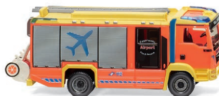
0612 43 Feuerwehr – AT LF (MAN TGM Euro 6/Rosenbauer) Löschfahrzeug im Flughafendienst UVP 40,99 €