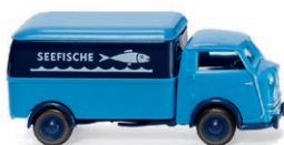
0335 06 Tempo Matador Kastenwagen Fangfrisch auf den Tisch UVP 14,99 € · 1949-52