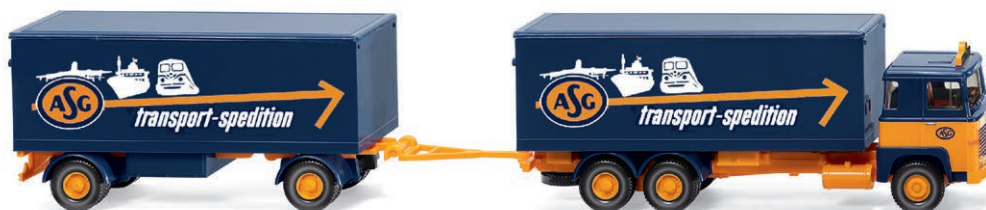
0457 03 Koffelhängerzug (Scania 111) Youngtimer der legendären Schweden-Spedition UVP 35,49 € · 1974-80