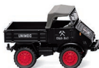
0870 67 Unimog U 411 Allrader im Bergbaueinsatz UVP 18,99 € · 1950-51