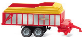
0956 02 Pöttinger Jumbo Ladewagen Spur N 1:160 Transporter für topaktuelle Schlepper-Gespanne UVP 11,99 €