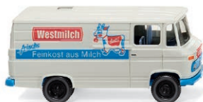
0270 58 MB L 406 Kastenwagen Milchversorgung im Westen UVP 17,49 € · 1967-74