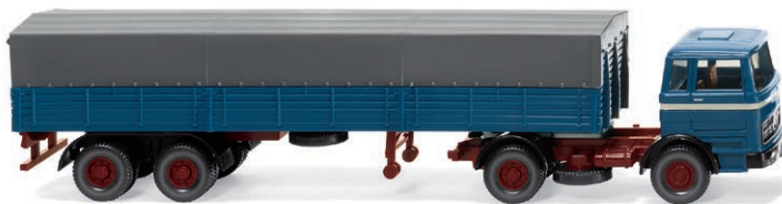
0514 05 Pritschensattelzug (MB) Güterfernverkehr in den 70er-Jahren UVP 22,99 € · 1968-74