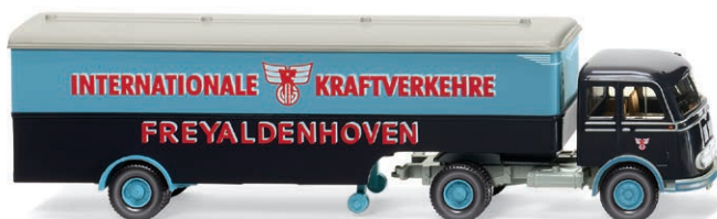
0513 24 Koffersattelzug (MB Pullman) Terminfracht und Liniendienst UVP 23,99 € · 1955-63