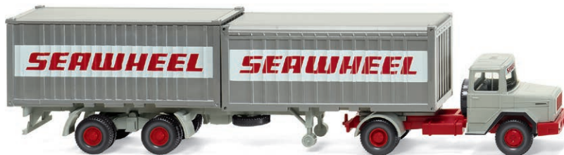
0524 02 Containersattelzug (Magirus Deutz) Eckhauber im Hafeneinsatz UVP 26,99 € · 1970-74