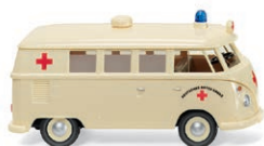
0797 29 VW T1 Bus Einstiger Standard-Krankenwagen der Ortsvereine UVP 20,49 € · 1963-67