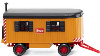
0656 08 Bauwagen Hofklassiker für Revier-Baufirma UVP 17,49 € · 1961-79